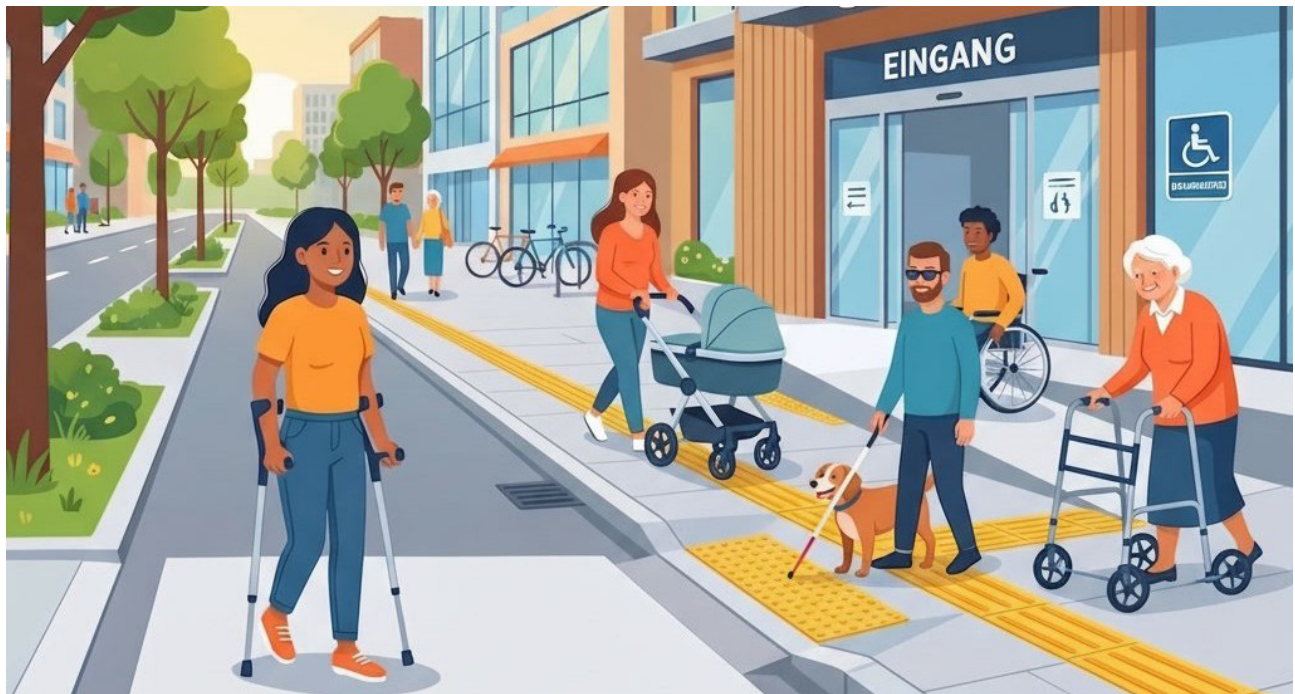
Hindernisfreies Bauen dient der Gesellschaft und Menschen mit Mobilitätseinschränkungen

kontakte | rechtsdienst | bauberatung | sport